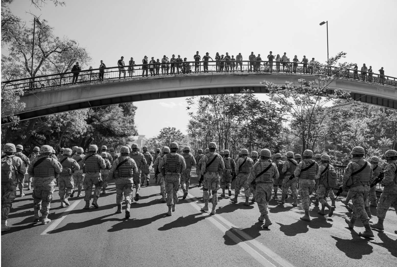
AUTOR/A: AUTOR: LEE BUSEL SANTIAGO, CHILE (2019)