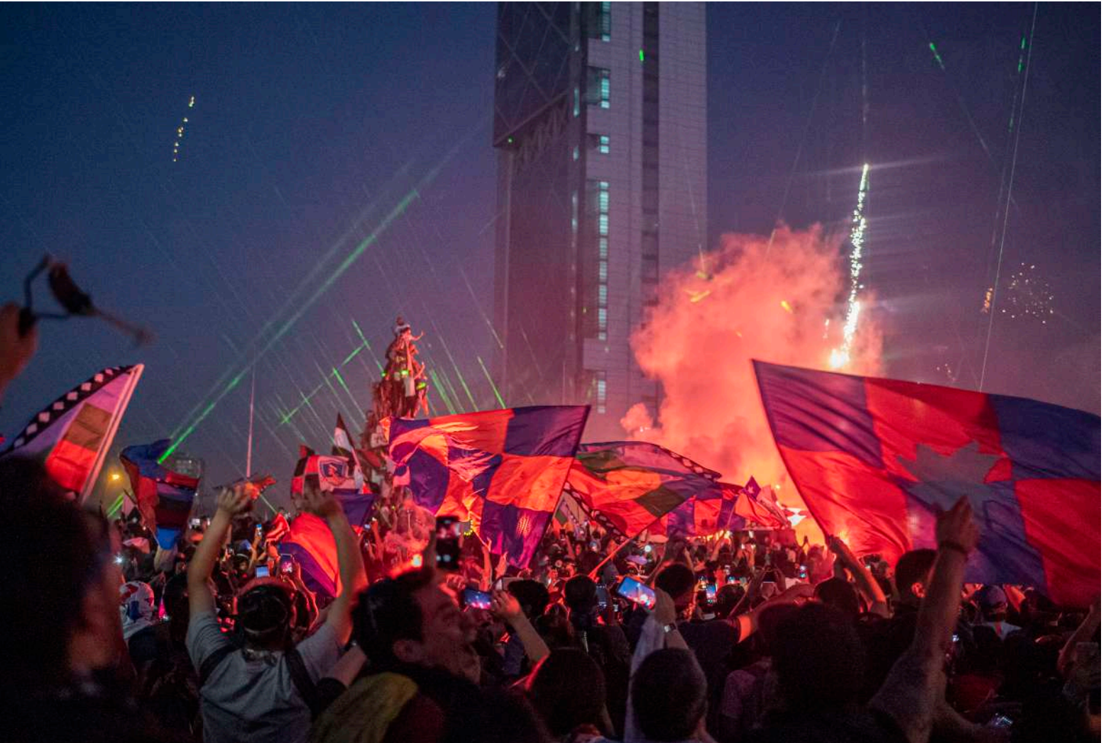
AUTOR/A: LEE BUSEL SANTIAGO, CHILE (2019)