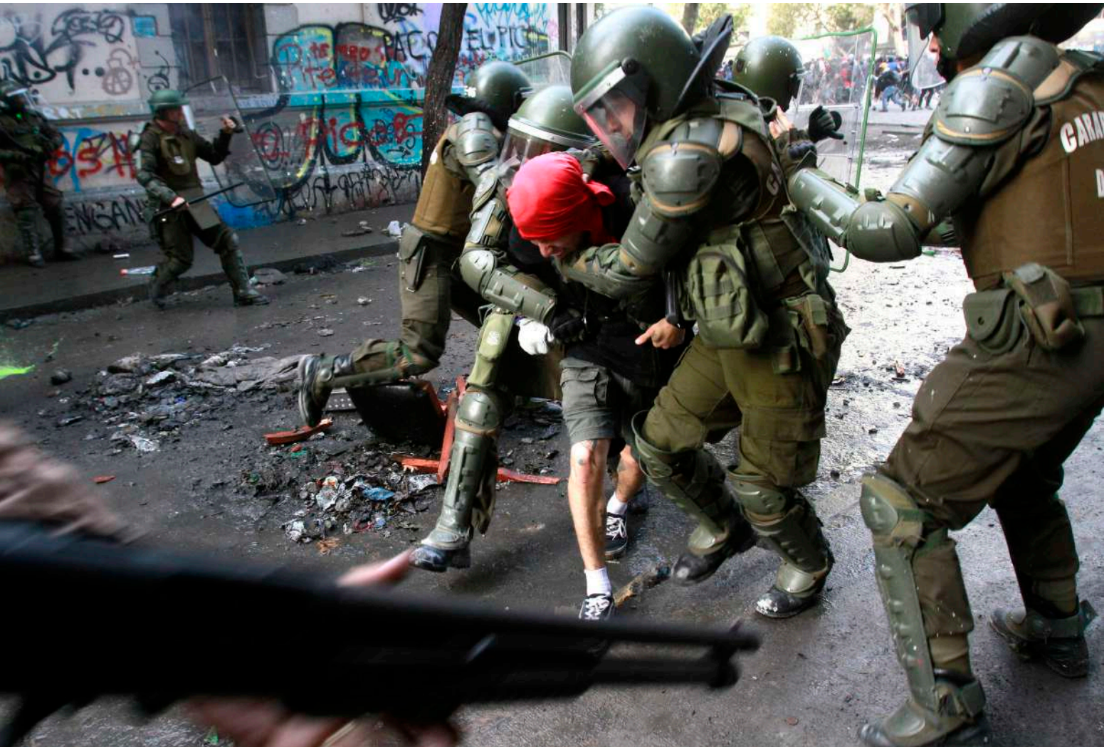
AUTOR/A: JONNATHAN OYARZÚN SANTIAGO, CHILE (2019)