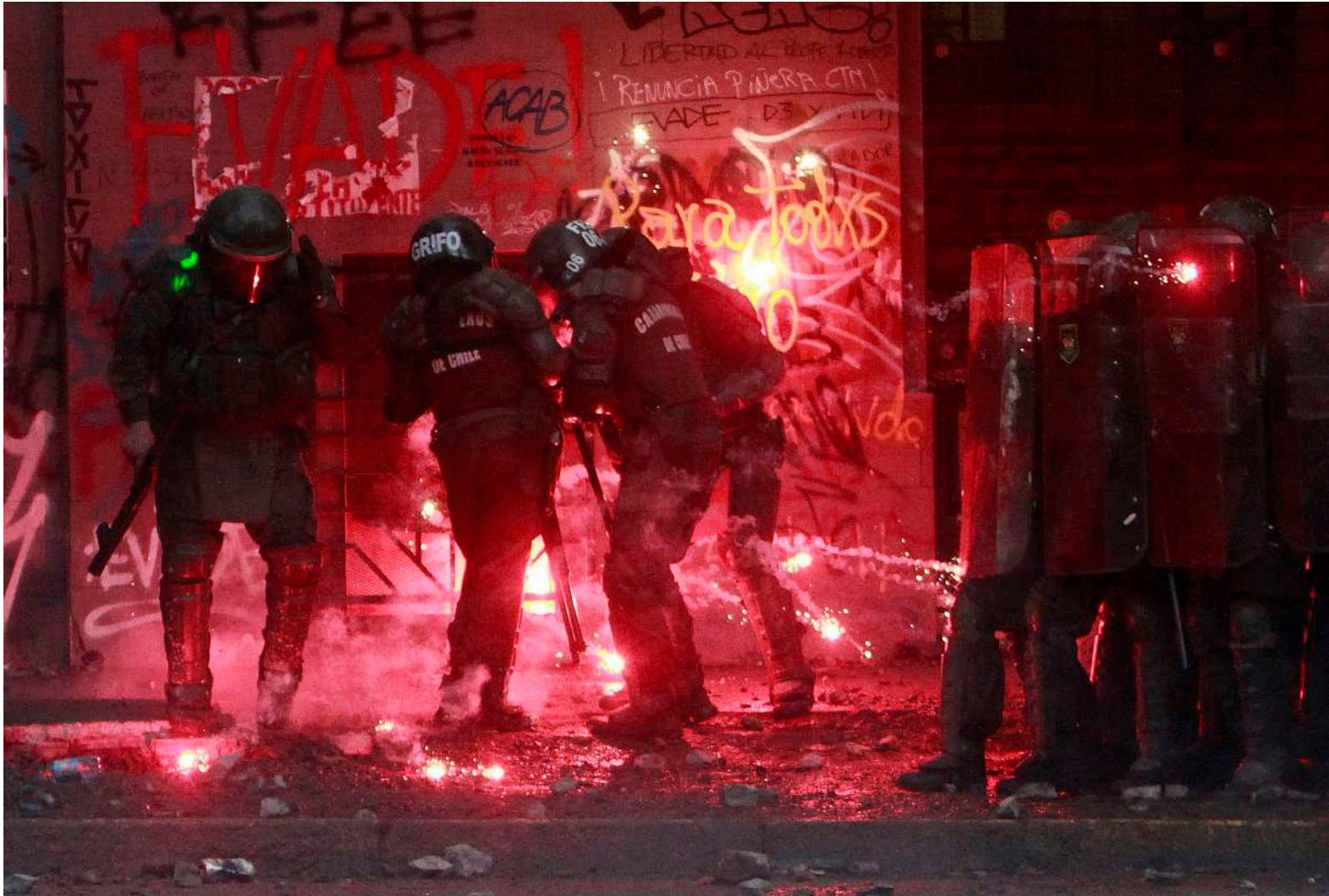
AUTOR/A: JONNATHAN OYARZÚN SANTIAGO, CHILE (2019)