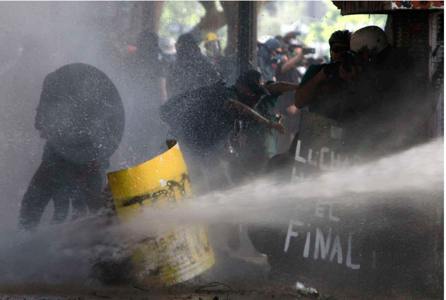
AUTOR/A: JONNATHAN OYARZÚN SANTIAGO, CHILE (2019)